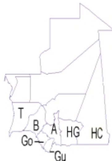
Carte 3. Mauritanie: la pluviométrie en millimetres